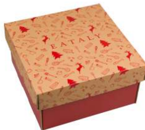
LARGE DIM: CM 38X38X18