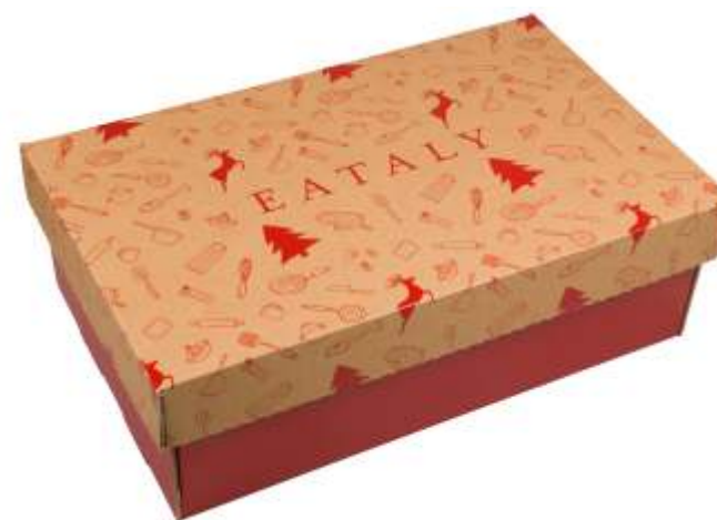
EXTRA-LARGE DIM: CM 58X35X19

Le nuove scatole regalo di Eataly sono più rispettose dell'ambiente perché sono fatte di carta riciclata. Posseggono anche la certificazione FSC che dimostra in maniera corretta, trasparente e controllata l'attivo contributo ad una gestione forestale responsabile.