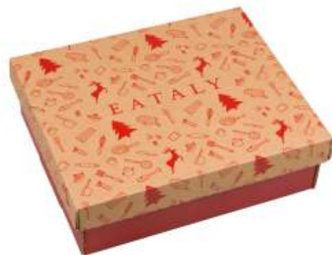
MEDIUM DIM: CM 35X29X10